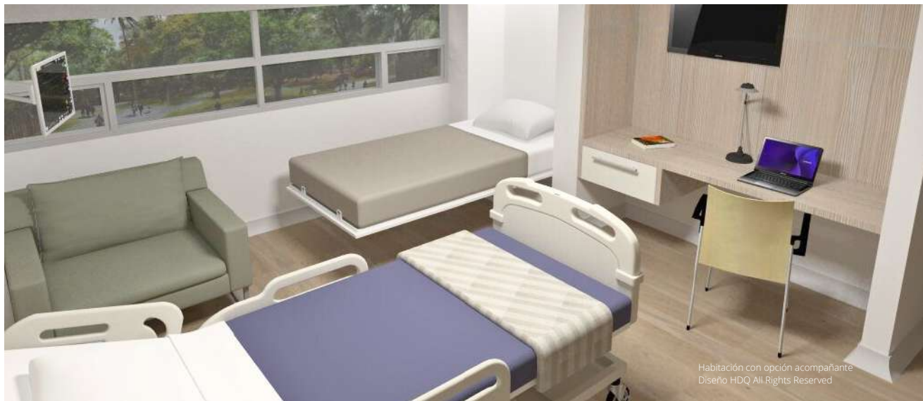
Habitación con opción acompañante Diseño HDQ All Rights Reserved

Para saber si el proyecto cumple los criterios ASPECT es importante llevar a cabo evaluaciones periódicas del entorno construido utilizando los criterios de diseño establecidos, e involucrar al personal médico y a los pacientes en el proceso de evaluación para obtener retroalimentación y sugerencias de mejora.