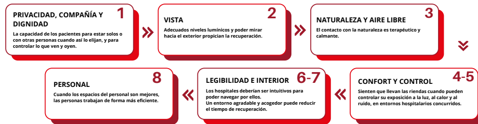
Gráfica 1: ASPECT: Ruddock, S. and Aouad G., 2009, "Creating impact in healthcare design: assessment through design evaluation", University of Stalford, Stalford

construido tiene áreas, espacios o zonas en donde no se lograron los objetivos finales de un entorno asistencial seguro o que el propio diseño generó sobrecostos o variaciones al momento de la ejecución técnica; para que otros proyectos y organizaciones de salud puedan aprender de estas experiencias.