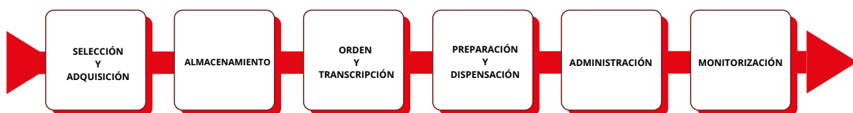
Gráfico 1. Gestión de Medicamentos

EAM (Evento Adverso por Medicamento) , es cualquier incidente PREVENIBLE, que puede causar daño al paciente